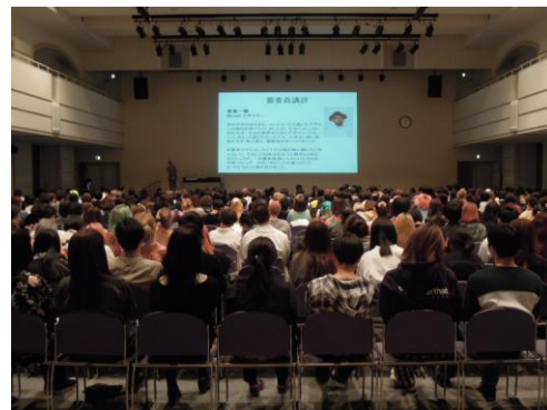
会場には約 500 名が集まりファッション大賞の概要説明に聴き入りました。

また同日、過去に入賞したデザイン画の展示会も行われました。展示会では、2014年～2016年に入賞した作品など、100点以上のデザイン画が展示され、学生は真剣な眼差しで作品を見学しました。