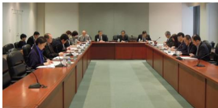
平成 29 年度第 1 回国際ファッション産学推進機構委員会の様子