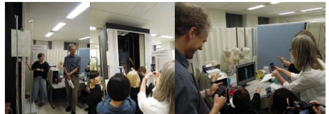
② 続いて、文化・服装形態機能研究所へ。三次元の計測器に興味津々の研究員の方々