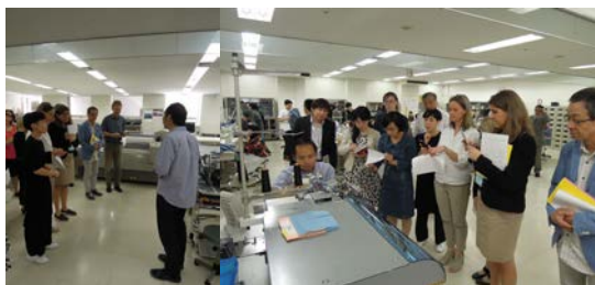
③ 次は、工業用機材を多数揃える生産管理実習室へ。