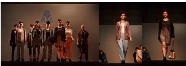
今回は“気軽さ”がテーマのレザー商品を多く提案した No,No,Yes! 顧客を意識したショーモデルを起用しました。