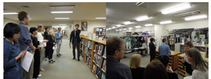
④ その他、図書館やファッションリソースセンターも見学されました。