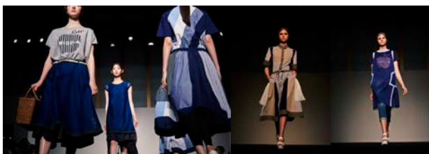
“SEE HERE BUY THERE”をテーマとして、タイムリーな商品を披露した MIDDLEA

6回目となるこのイベントも回を重ねるごとに洗練され、それと同時に認知度も上がり、盛り上がりを見せてきました。今回も、恒例となっているドリンクサービスやファッションショーはもちろん、臨場感あふれるライブパフォーマンスも行われました。来場者はOPENからCLOSEまで途切れることなく、常に会場は熱気で溢れ、笑顔で買い物をするお客様の姿でいっぱい。イベントは大成功に終わりました。