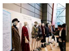
産地コラボで制作した作品の展示も行われました。