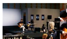
アーティストによるライブパフォーマンスも会場を盛り上げました。