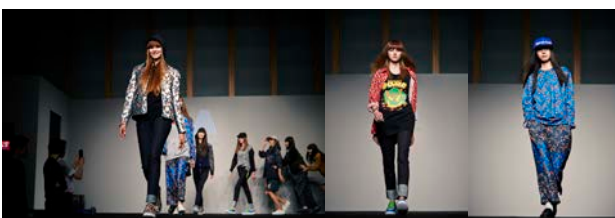
個性豊かで見る者を引き付ける商品を披露したユキヒーロープロレス。今回もワクワクする楽しいショーとなりました。