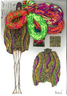
長谷川 ひな子 東京モード学園