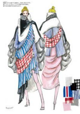
Park Yoon hee (韓国) Samsung Art&design Institute