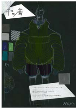
渡邊 物 マロニエファッションデザイン専門学校