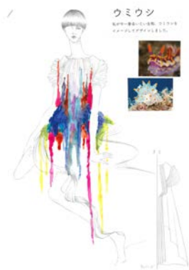
李 世惺 文化服装学院