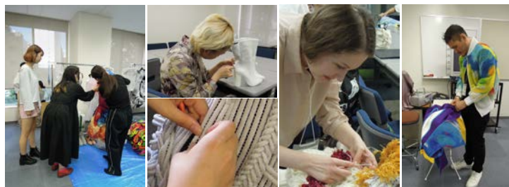
am11:00. 作品を修理しながら微調整を行う。フィッター、モデルとのミーティングにも熱が入る。