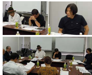
pm15:30. 審査終了。審査結果が集計され、各賞が決定した。