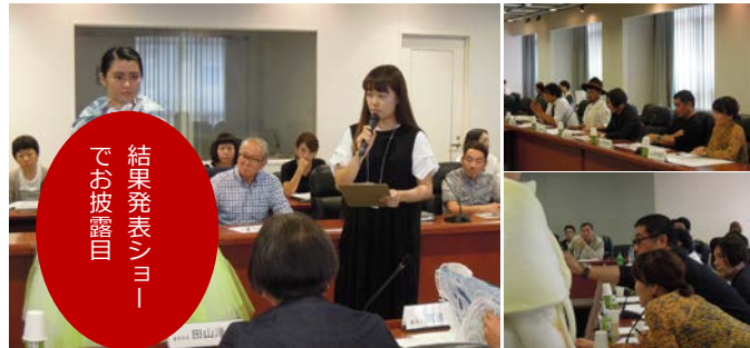
pm13:20. 最終審査会開始。自分の作品をプレゼンする候補者。審査員は、作品に対して質問したり、素材の確認をしたりするなど、厳正な審査が行われた。