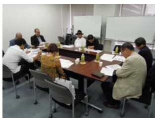
pm12:30. 審査員が到着。事務局より審査説明が行われる。