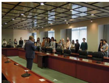
am10:00. ファイナリスト 25 名が集合し、審査の流れを説明。